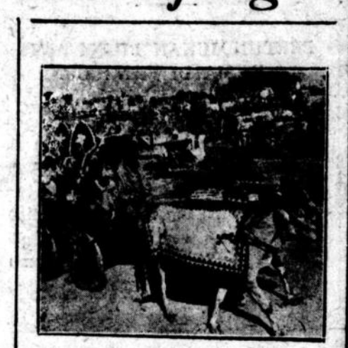
Bukan sadija kaum Muslimin da ri India dan Pakistan yang me ngundjungi Keramat Roza Sharif di Sirhind (India), tetapi seba gai ternjata dari gambar diatas turut djuga kaum Hindu dan Sikh.

Setiap orang asing di Jugoslavia atas perintah Pemerintah mengemba dokumen2 melantjong yang wajdj di pakai kalau melantjong djid lam negeri atau bila keluar dari ne geri. Perbuatan ini nampaknja seba gai langkah balasan terhadap penju supan oleh anasir2 yang anti-Peme rintah dari negeri2 tetangganya djid lam Komintern.